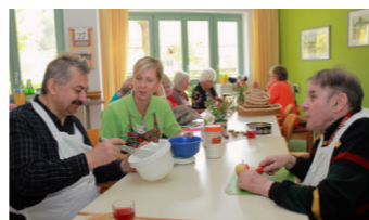
Tagespflege - Kuchenbacken