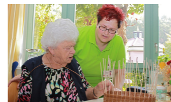
Tagespflege - Körbgeflechten