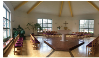
Kapelle im St. Monika