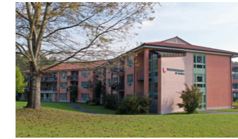
Außenansicht von Westen