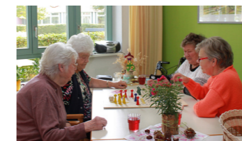
Tagespflege - Gemeinsam spielen