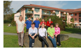
Mitarbeiter der Verwaltung